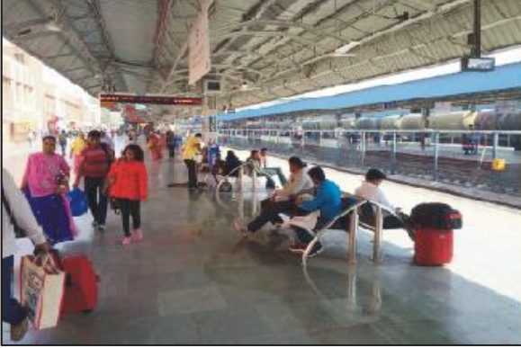
डॉ. अभिषेक सिंघवी के सांसद निधि के सहयोग से जोधपुर रेलवे स्टेशन पर यात्रियों के लिए बैठने की सुविधाएँ

यात्रियों की बढ़ती संख्या के लिए ये सुविधाएँ पर्याप्त नहीं रही हैं। डॉ. सिंघवी ने अंतर्दृष्टि से इन अपर्याप्त सुविधाओं को महसूस किया और इस दिशा में अपनी सांसद निधि से भी बढ़-चढ़ कर योगदान दिया।