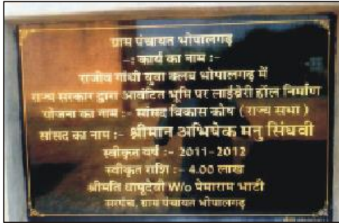
राजस्थान भर में पंचायतों में युवा गतिविधि के लिए कई हॉलों में से एक के लिए उद्घाटन पट्टिका (भोपालगढ़ में)

आज कल वाचनालय एक महत्वपूर्ण जगह बन चुकी है। हालाँकि संचार क्रांति के चलते आज घर और विदेश से संबंधित जानकारियाँ तुरंत उपलब्ध हो जाती हैं, परंतु मुद्रित शब्द हमेशा से ही अधिक मूल्यवान माने जाते हैं।