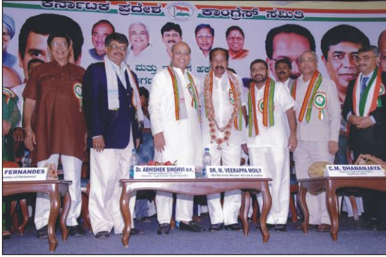
कांग्रेस के विधि और मानवाधिकार विभाग के एक कार्यक्रम के दौरान डॉ. अभिषेक सिंघवी, वीरप्पा मोईली और ऑस्कर फर्नांडीज़ के साथ

उन्हें प्राइम टाइम टेलीविजन पर शोर-गुल मचाना कभी पसंद नहीं आता है। पत्रकार बरखा दत्त डॉ. सिंघवी के व्यक्तित्व पर बात करते हुए कहती हैं, 'मुझे लगता है कि अभिषेक की विशेषता यह है कि वह नाटकीय नहीं हैं, बहुत स्पष्टवादी हैं और उनको जटिल समस्या को सुलझाने के लिए बहुत कम समय की जरूरत होती है।' इसके अलावा, शोभना भरतिया ने भी सिंघवी के व्यक्तित्व को यह कहते हुए सराहा कि, 'उनका दिमाग बहुत तेज है। मैंने उन्हें कभी भी थका हुआ नहीं पाया। उन्हें हर किस्म के मुद्दों का सामना करना पड़ा है। वह बहुत ही तर्कसंगत तर्कों के साथ पार्टी के स्टैंड का जवाब देते हैं और बचाव करते हैं।'