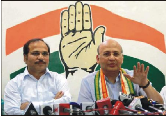
कोलकाता में प्रेस वार्ता करते हुए डॉ. अभिषेक सिंघवी

उन्हें प्राइम टाइम टेलीविजन पर शोर-गुल मचाना कभी पसंद नहीं आता है। पत्रकार बरखा दत्त डॉ. सिंघवी के व्यक्तित्व पर बात करते हुए कहती हैं, 'मुझे लगता है कि अभिषेक की विशेषता यह है कि वह नाटकीय नहीं हैं, बहुत स्पष्टवादी हैं और उनको जटिल समस्या को सुलझाने के लिए बहुत कम समय की जरूरत होती है।' इसके अलावा, शोभना भरतिया ने भी सिंघवी के व्यक्तित्व को यह कहते हुए सराहा कि, 'उनका दिमाग बहुत तेज है। मैंने उन्हें कभी भी थका हुआ नहीं पाया। उन्हें हर किस्म के मुद्दों का सामना करना पड़ा है। वह बहुत ही तर्कसंगत तर्कों के साथ पार्टी के स्टैंड का जवाब देते हैं और बचाव करते हैं।'