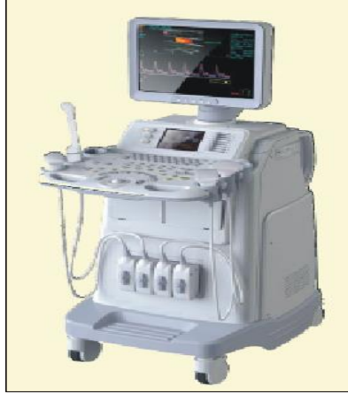
डॉ. अभिषेक सिंघवी के सहयोग से राजकीय चिकित्सालय, जालौर, राजस्थान में सोनोग्राफी मशीन

इस क्रम में उन्होंने अपनी सांसद निधि से दस लाख रुपए में प्राथमिक स्वास्थ्य केंद्र, स्वरूपगंज, जिला सिरोही में प्रसूति कक्ष और मोर्चरी कक्ष का निर्माण कराया और राजकीय प्राथमिक स्वास्थ्य केंद्र, रोहिड़ा, जिला सिरोही में छः लाख से वार्ड और मोर्चरी कक्ष का निर्माण कराके अनुसूचित जाति और अनुसूचित जनजातियों के लिए अपनी सहानुभूति दिखाई है।