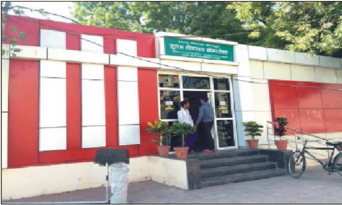
डॉ. अभिषेक सिंघवी के सहयोग से राजस्थान के विभिन्न जिलों में सुलभ शौचालयों का निर्माण

खुले शौचालय से राहत के इस अभियान में सक्रिय रूप से भाग लेनेवाले डॉ. सिंघवी ने निम्नलिखित क्षेत्रों में से प्रत्येक में सांसद निधि से धन मंजूर करा कर सार्वजनिक सुलभ शौचालयों का निर्माण करवाया है। पश्चिमी राजस्थान के जालोर जिले में जसवंतपुरा पंचायत समिति के गाँव मण्डोली में 22 लाख रुपए, सिरोही कलेक्ट्रेट परिसर, सिरोही के टाकलिया जालोर शहर के नगर पालिका क्षेत्र में दो सुलभ शौचालयों का निर्माण और बालोतरा नगर पालिका में प्रत्येक को 20-20 लाख रुपए आवंटित किए। इसी तरह उन्होंने अपनी सांसद निधि से 25 लाख रुपए की लागत से पाली शहर क्षेत्र, जैसलमेर के राजकीय जवाहर अस्पताल और पोकरण नगर नगरपालिका क्षेत्र में सार्वजनिक सुलभ शौचालय के निर्माण में महत्वपूर्ण सहयोग किया।