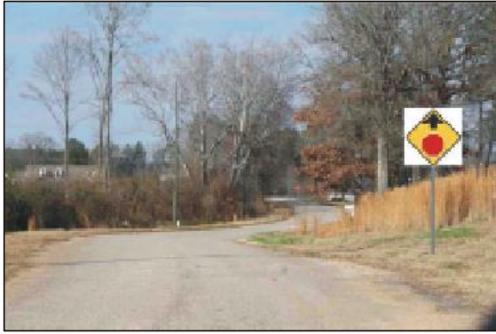
डॉ. अभिषेक सिंघवी के सांसद निधि के सहयोग से राजस्थान में सड़कों का निर्माण

सभी सामाजिक-धार्मिक गतिविधियों की अपनी जिम्मेदारी का निर्वहन करते हुए डॉ. सिंघवी ने 40 लाख रुपए की लागत से एडवोकेट भवन निर्माण हेतु विवेक विहार, जोधपुर में अपनी सांसद निधि से धन की मंजूरी दे कर एक महत्वपूर्ण भूमिका निभाई जोधपुर के कमला नेहरू नगर में 8 लाख रुपए की लागत से नेत्रहीन विकास संस्थान में सार्वजनिक हॉल का निर्माण चौपासनी हाउसिंग बोर्ड में स्थित नवज्योति मनोविकास केंद्र में 10 लाख रुपए की लागत से दो कमरे का निर्माण और 20 लाख की लागत से पाली में बार चैंबर का निर्माण करके महत्वपूर्ण भूमिका निभाई।