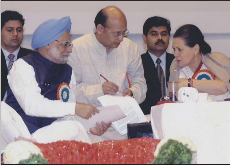
पूर्व प्रधानमंत्री डॉ. मनमोहन सिंह और सोनिया गाँधी के साथ डॉ. अभिषेक सिंघवी