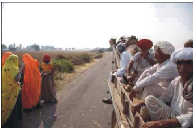
ग्रामीण राजस्थान में कई परियोजनाओं में से एक का उद्घाटन