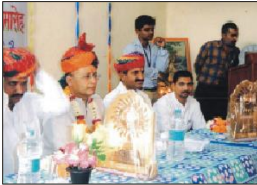
जोधपुर के राजकीय उच्च माध्यमिक विद्यालय, पुलिस लाइन में कंप्यूटर लैब के लोकार्पण के दौरान डॉ. अभिषेक सिंघवी

डॉ. सिंघवी अपने गृह जिले में महान कार्यों में अपनी सांसद निधि का उपयोग करते हुए अपने विवेक के आधार पर कह सकते हैं कि सांसद निधि का कितना फायदेमंद तरीके से उपयोग किया जा सकता है।