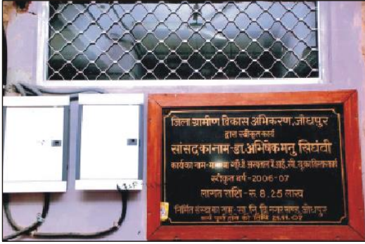
डॉ. अभिषेक सिंघवी के सहयोग से आईसीयू विस्तार कार्य, महात्मा गाँधी अस्पताल, जोधपुर, राजस्थान

डॉ. सिंघवी ने अपने जिले के अलावा दूसरे जिलों में स्वास्थ्य सेवाओं के लिए भी कोई कम सहयोग नहीं किया। यह 'सभी के लिए कल्याण, सभी के लिए खुशी' के सिद्धांत के प्रति उनके गहन प्यार की पुष्टि करता है। अपने इस विचार को साबित करते हुए उन्होंने जोधपुर के निकट पाली जिले के सबसे बड़े बांगड़ अस्पताल के लिए अपनी सांसद निधि से 20 लाख रुपए की मंजूरी दी। जालोर के जिला अस्पताल में सोनोग्राफी मशीन के लिए 12 लाख रुपए और प्राथमिक स्वास्थ्य केंद्र रेवतड़ा जालोर में प्रयोगशाला कक्ष और महिलाओं के वार्ड के निर्माण के लिए 8 लाख रुपए की स्वीकृति उनकी समानुभूति को परिभाषित करती है।