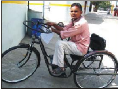
डॉ. अभिषेक सिंघवी के सांसद निधि से विकलांगों को ट्राई साइकिलें प्रदान की गईं

इसी क्रम में, उन्होंने जोधपुर जिले के विकलांगों को साइकिलों के वितरण हेतु अपनी सांसद निधि से 5 लाख रुपए की मंजूरी दी और इस प्रकार उन्होंने सामाजिक न्याय व सशक्तीकरण के रूप में एक बेहतरीन काम किया। इसी तरह के खास निर्माण के लिए संसद सदस्य सिंघवी ने अपने गृह जिले के लूणावास कला गाँव की शमशान भूमि पर एक टीन शेड का निर्माण करके राहत प्रदान की। इस तरह से निर्माण कार्यों को निष्पादित करना ही डॉ. सिंघवी का अंतहीन मकसद है।