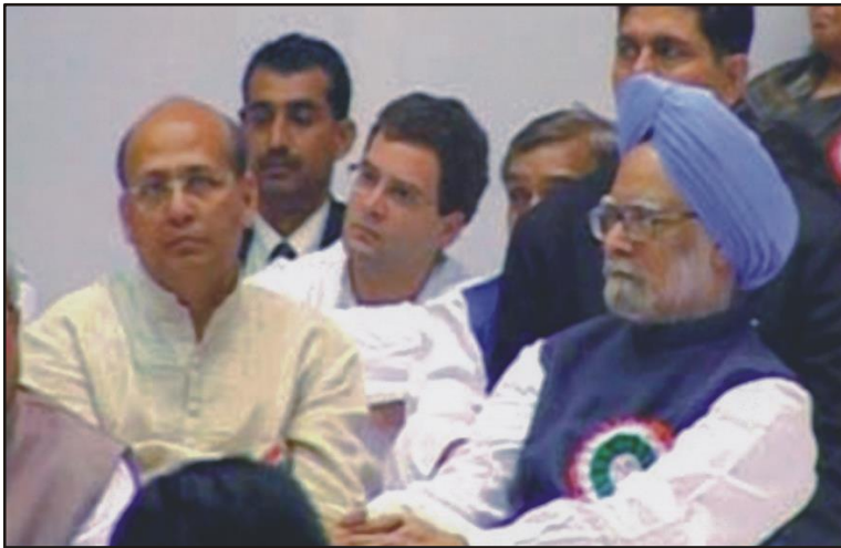
पूर्व प्रधानमंत्री डॉ. मनमोहन सिंह और राहुल गाँधी के साथ डॉ. अभिषेक सिंघवी