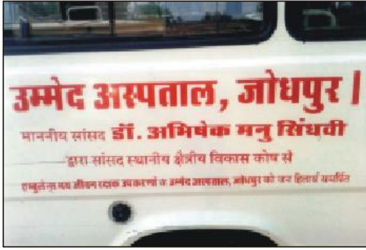
डॉ. अभिषेक सिंघवी के सहयोग से जीवन रक्षक एंबुलेंस वाहन

बढ़ती आबादी और मरीजों की संख्या में लगातार होती वृद्धि के चलते, उन्होंने कार्यकारी अभियंता, लोक निर्माण विभाग की देखरेख में महात्मा गाँधी अस्पताल, जोधपुर में आईसीयू के विस्तार के लिए अपनी सांसद निधि से 8.25 लाख रुपए का निवेश किया।