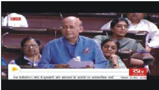
संसदीय कार्यवाही के दौरान डॉ. अभिषेक सिंघवी