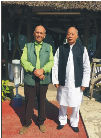
इबोबो सिंह के साथ डॉ. अभिषेक सिंघवी

अपनी पार्टी के सबसे अच्छे दिमाग में से एक होने के नाते डॉ. अभिषेक मनु सिंघवी को अक्सर कांग्रेस के सर्वश्रेष्ठ मंत्रियों में से एक के रूप में जाना जाता रहा है। 2007-08 के बाद लगभग हर मंत्रिमंडल में फेर-बदल के समय उन पर विचार किया गया और वह हमेशा ही दौड़ में आगे पाए गए, खासकर 2009 के बाद, यूपीए 2 में। लेकिन वह यह भी मानते हैं कि उनको नतीजे देने वाला विभाग नहीं मिला तो निश्चित ही वह निराशा से ग्रस्त होंगे, क्योंकि उन्हें हमेशा से ही सजावटी भूमिका से तकलीफ होती रही है। इसके अलावा डॉ. सिंघवी श्रीमती सोनिया गाँधी के साथ अपने घनिष्ठ संबंधों को मानते हैं, जिन्होंने उन पर विश्वास जताया और उन्हें 2001 में प्रवक्ता नियुक्त किया। डॉ. सिंघवी स्वीकार करते हैं कि कांग्रेस में उनका राजनीतिक सफर, करियर के नज़रिए से मील का पत्थर साबित नहीं हुआ, जैसा कि उन जैसे प्रतिभा के धनी बहुमुखी व्यक्ति का हो सकता था, लेकिन वह अकृतज्ञ और शिकायतकर्ता नहीं बनना चाहते। उन्हें याद है कि कैसे बड़े प्रस्तावों के साथ दूसरे प्रमुख राजनीतिक दलों द्वारा समय-समय पर उनसे संपर्क किया जाता था, लेकिन उनका मानना है कि यह कांग्रेस और उन सभी का दोष है, जिनकी विचारधारा उनके राजनीतिक दर्शन से मेल खाती है। अगर उन्हें उचित जिम्मेदारियों को विश्वास के साथ सौंपा गया तो उन्होंने पार्टी के लिए त्याग करने में कभी हिचकिचाहट नहीं की है।