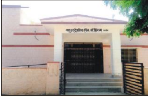
जालौर, राजस्थान के जिला मुख्यालय का ऑडिटोरियम, जिसका निर्माण डॉ. अभिषेक सिंघवी के सहयोग से हुआ

डॉ. अभिषेक मनु सिंघवी द्वारा अपनी सांसद निधि से कई समुदायिक हॉल और साधारण हॉल का निर्माण कराया गया है, जिसे शिक्षा के वातावरण को बनाने में बहुत ही उपयोगी माना गया।