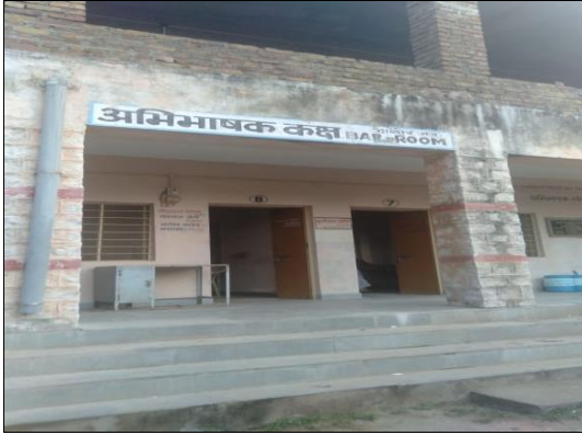
डॉ. अभिषेक सिंघवी के सहयोग से निर्मित अभिभाषक कक्ष, जालोर, राजस्थान

डॉ. सिंघवी ने जालोर जिले के रानीवाड़ा में राजकीय उच्च माध्यमिक विद्यालय में पवेलियन और सीढ़ियों के निर्माण के लिए 41.54 लाख रुपए की मंजूरी दी। इसी तरह उन्होंने जालोर जिला मुख्यालय स्टेडियम में एक सभागार के निर्माण के लिए 60 लाख रुपए की मंजूरी दी।