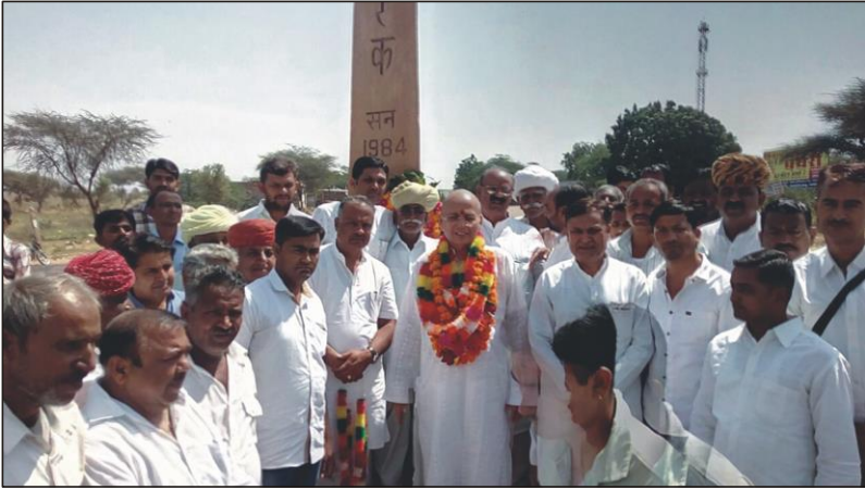
डॉ. अभिषेक सिंघवी का शेरागढ़, जोधपुर में ग्रामीणों द्वारा स्वागत

समिति के चेयरमैन हैं, तो दूसरी तरफ वह मानवाधिकारों के संयुक्त सचिव जैसे महत्वपूर्ण पद की गरिमा को बढ़ाते हैं। कई अंतरराष्ट्रीय और राष्ट्रीय संस्थानों में पूरी मानव जाति और उनकी समस्याओं के समाधान के प्रति उनकी सक्रियता उनके विचारों का प्रमाण देती है, क्योंकि उनके जीवन का मुख्य आदर्श 'वसुधैव कुटुंबकम्' (पूरा संसार एक परिवार की तरह) है। राजनीतिक दुनिया में वह कड़ी मेहनत और मानव सेवा के सच्चे दूत हैं।