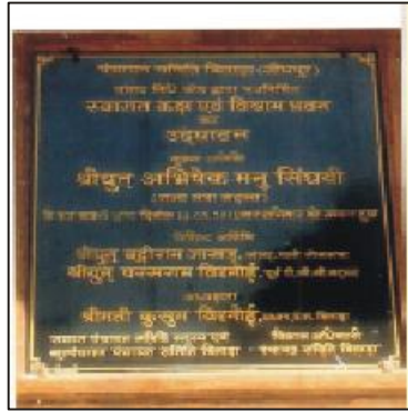
राजस्थान भर में कई सामाजिक कल्याण हॉल में से एक उद्घाटन पट्टिका

आज़ादी के बाद से, राजस्थान में स्वास्थ्य सेवा लगातार प्रगति कर रही है, परंतु यह विकास ग्रामीण क्षेत्रों के बनिस्बत शहरों में ज्यादा दिखाई देता है। हमें सभी के लिए स्वास्थ्य सुनिश्चित करने और स्वस्थता का शंखनाद करने के लक्ष्य के साथ आगे बढ़ना होगा और केवल तभी एक स्वस्थ समाज को देखा जा सकता है। इस उद्देश्य की पूर्ति हेतु डॉ. अभिषेक मनु सिंघवी का नाम उन जन-प्रतिनिधियों में सबसे आगे गिना जाता है, जिन्होंने इन विचारों को अपने दिमाग में पोषित किया है। ग्रामीण स्वास्थ्य के सुधार के लिए कुछ करने का इरादा उन्हें यह सुझाव देता है कि स्वास्थ्य सेवाओं को जिले के दूरस्थ कोनों में अच्छा होना चाहिए। इसी सुझाव पर अमल करते हुए उन्होंने केतु मदा पंचायत बालेसर उपखण्ड के भीतर जवाहर नगर में उप स्वास्थ्य केंद्र का निर्माण कराया, जिसके लिए उन्होंने अपनी सांसद निधि से 4.00 लाख रुपए मंजूर किए।