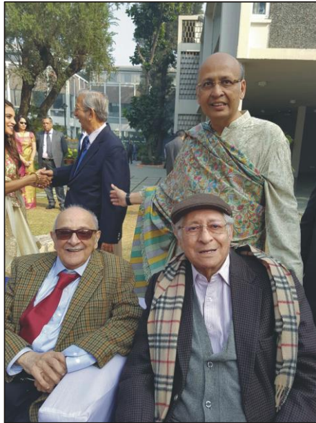
फली नरीमन और सोली सोराबजी के साथ डॉ. अभिषेक सिंघवी