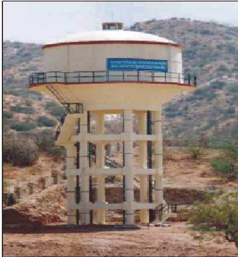
डॉ. अभिषेक सिंघवी के सहयोग से निर्मित पानी की टंकी, सियेही, राजस्थान

राजस्थान का मरुस्थल, क्षेत्र में पानी की कमी के कारण सभी जगह बहुत ही डरावना दिखाई पड़ता है। यूं तो सरकार द्वारा इस समस्या के हल के लिए कई योजनाओं को सालों से लागू किया जा रहा है, परंतु दूरस्थ ग्रामीण इलाकों में यह समस्या अत्यंत विकट है। डॉ. सिंघवी इस समस्या से भली-भांति परिचित हैं और इस समस्या से राहत दिलाने के लिए उन्होंने सांसद निधि का इस्तेमाल किया है और हमेशा ही सहयोग करने के लिये तत्पर रहे हैं। वह यह भी जानते हैं कि यह समस्या सिर्फ उनके गृह जिले तक सीमित नहीं है, बल्कि सभी जिलों में फैली हुई है। इस नजरिए के साथ, उन्होंने अपने गृह जिले के अलावा भी अन्य जिलों को अपना मुमकिन सहयोग दिया है। सार्वजनिक जन स्वास्थ्य अभियांत्रिकी विभाग, जिला जोधपुर के तहत भोपालगढ़ पंचायत समिति के अंतर्गत बेरा रतकुड़िया भीलों की ढाणियों तक जी. एल. आर. और पानी टैंक को स्थापित करने के लिए उन्होंने अपनी सांसद निधि से 5.0 लाख रुपए मंजूर किए, ताकि इस क्षेत्र में पेयजल सुविधा उपलब्ध हो सके।