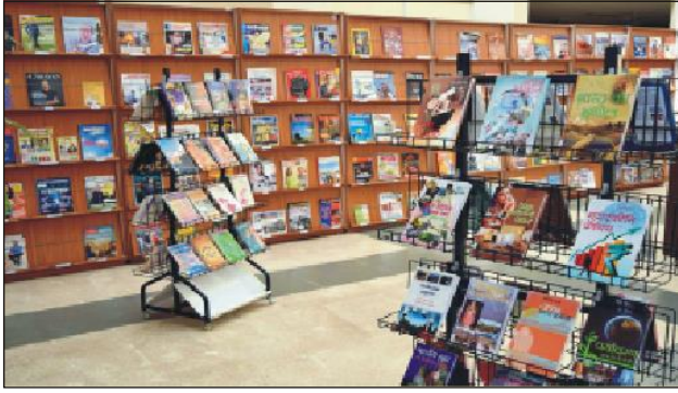
होपारी ग्राम पंचायत में सार्वजनिक वाचनालय का निर्माण

अपने विचारों के अनुरूप डॉ. सिंघवी ने होपारड़ी ग्राम पंचायत में एक सार्वजनिक वाचनालय का निर्माण करवाया। इसके साथ ही उन्होंने भोपालगढ़ पंचायत समिति में सरकार द्वारा आवंटित एक जमीन पर लाइब्रेरी हॉल के निर्माण में सहयोग दिया जिससे कि ग्रामीण आबादी की पढ़ाई के प्रति रूचि जागृत करने के अलावा उन्हें हमारे देश और अन्य देशों की जानकारी भी दी जा सके, यह लोगों के ज्ञान में सुधार करने में महत्वपूर्ण साबित होगा। उन्होंने नागौर जिले के रियाबड़ी पंचायत समिति के लिलीया गाँव में सार्वजनिक वाचनालय के निर्माण के लिए अपनी सांसद निधि से 7 लाख रुपए, राजकीय उच्च माध्यमिक विद्यालय में पुस्तकालय भवन के निर्माण के लिए 8 लाख रुपए, जोधपुर के केरू मण्डोर पंचायत समिति पुस्तकालय के निर्माण के लिए 8 लाख रुपए और इसके अलावा बाड़मेर के रावणा राजपूत छात्रावास के पास एक सार्वजनिक पुस्तकालय और वाचनालय के निर्माण के लिए 5 लाख रुपए की मंजूरी प्रदान की। यह सब समाज के सुधार और लोगों को जानकार बनाने में प्रभावी साबित होगा।