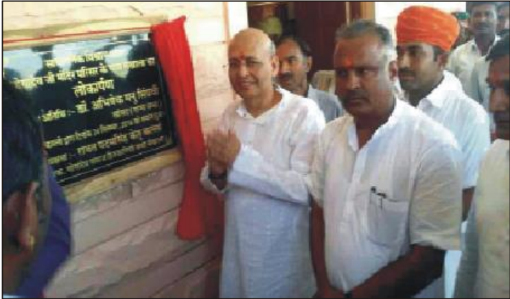
सामुदायिक भवन, सेखाला, जोधपुर का लोकार्पण करते हुए

यदि डॉ. सिंघवी द्वारा उनके स्वयं के जिले के अलावा दूसरे जिलों में उनकी सांसद निधि के उपयोग की पुष्टि करने के लिए एक सर्वेक्षण आयोजित किया जाए तो यह काफी स्पष्ट होगा कि डॉ. सिंघवी ने राजस्थान में अपने क्षेत्र के अलावा दूसरे क्षेत्रों की भी उतनी ही चिंता की है और प्रमुख आवश्यक निर्माण किए हैं। इस कार्यक्रम में शामिल पाली जिले के भीतर पीचका मार्ग आकदड़ा में सामुदायिक हॉल का निर्माण, जैसलमेर जिले के झाबरा गाँव में हनुमानजी बगतजी की ढाणियों में सामुदायिक हॉल का निर्माण, बाड़मेर के पचपदरा में भगवती मंदिर के पास में सार्वजनिक सेवा भवन का निर्माण, बाड़मेर जिले के कोजा गाँव में सार्वजनिक विश्राम घर का निर्माण, जैसलमेर जिले के सम के लखा में सार्वजनिक विश्राम घर का निर्माण, बाड़मेर जिले के सिवाना में केशर शाह दरगाह के पास में सार्वजनिक हॉल का निर्माण, जैसलमेर जिले के भादरिया गाँव में सार्वजनिक हॉल का निर्माण और अजमेर जिले के केकड़ी पंचायत समिति के भीतर सलारी गाँव में सामुदायिक हॉल का निर्माण, ऐसे कुछ उदाहरण हैं जो कि डॉ. सिंघवी की दूरदर्शिता का परिचय देते हैं।